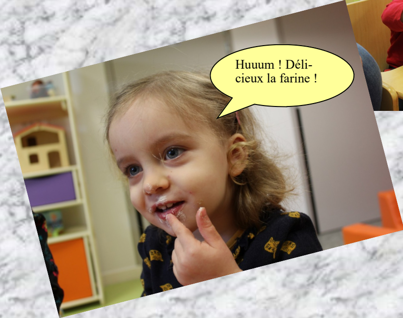
Huum ! Délicieux la farine !