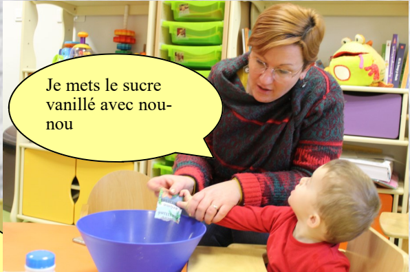
Je mets le sucre vanillé avec nou-nou