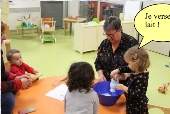
Je verse le lait !