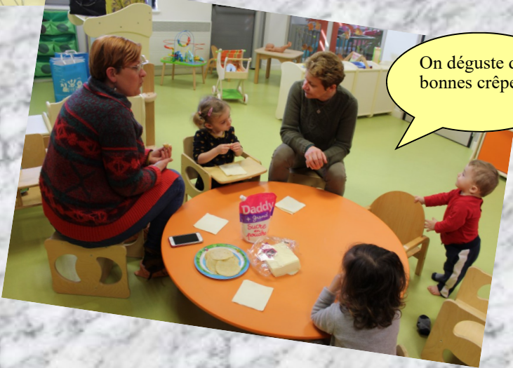
On déguste de bonnes crêpes