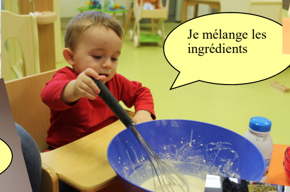
Je mélange les ingrédients